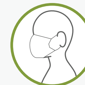
MASQUE SANS COUTURES FABRIQUÉ À PARTIR D'UNE ÉCHARPE PLIÉE OU D'UN BANDANA ET D'ÉLASTIQUES OU D'ATTACHES POUR LES CHEVEUX

Pour en savoir plus sur la fabrication de couvre-visage, veuillez consulter le site suivant : https://www.canada.ca/fr/sante-publique/services/maladies/2019-nouveau-coronavirus/prevention-risques/a-propos-masques-couvre-visage-non-medicaux.html