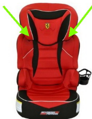
Figure 1. Emplacement des guides de ceinture épaulière

Il est possible que les étiquettes apposées sur le siège d'appoint et que les manuels d'instructions en français et en anglais distribués avec le siège n'indiquent pas la bonne configuration du guide de ceinture épaulière. En l'absence d'instructions adéquates, il est possible que la ceinture épaulière soit positionnée incorrectement, ce qui empêcherait la ceinture de glisser librement dans le guide. Les instructions révisées précisent la bonne façon de faire passer la ceinture épaulière dans le guide. Transports Canada a cerné ce problème dans le cadre du programme d'enquêtes sur les défauts après avoir reçu une plainte d'un consommateur.