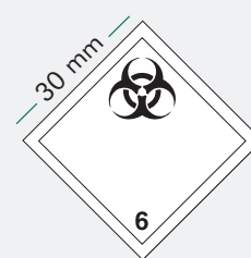
Carré reposant sur une pointe