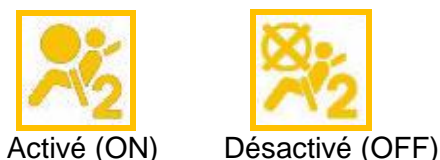
Figure 2 – Indicateur de l'état du coussin de sécurité gonflable du passager

Le voyant de défaillance des coussins de sécurité gonflables ne doit pas être confondu avec l' indicateur de l'état du coussin de sécurité gonflable du passager . Ce dernier se trouve sur le tableau de bord des véhicules munis d'un système de détection de passager du côté du passager avant. Cet indicateur allumera le symbole de coussin activé (ON) ou le symbole de coussin désactivé (OFF) afin de vous indiquer l'état du coussin de sécurité gonflable du passager (activé ou désactivé). Veuillez consulter le manuel du propriétaire pour de plus amples détails.